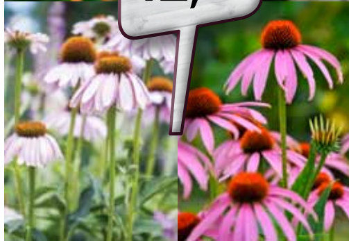
Ameriški slamniki, različne barve