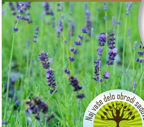
Sivka od 3,29 €.

Planike so stoletja kraljevale v naših gorah. Njeni zvezdasti beli cvetovi so tipično značilni za alpski svet. Nove sorte planik so prilagojene tudi rastiščem v nižjih predelih. Te trajnice s cvetenjem razveseljujejo v zgodnjem poletju in polejšajo skalnjak. Da podaljšamo čas cvetenja, posadimo zgodnje sorte.