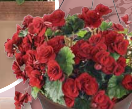
CVETLIČNA OBEŠANKA Plastična, temno rjave barve, ø 31 cm (brez vsebine). 2,69 €

Peštra izbira cvetličnih loncev iz gline, kombinacija gline z vlakni Fiberclay, plastike z imitacijo ratana, različnih barv in oblik.